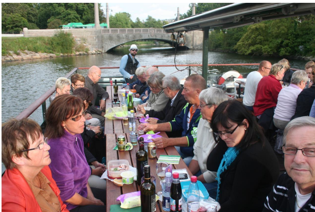
Vi slutar med två hoppningvande sommarbilder.