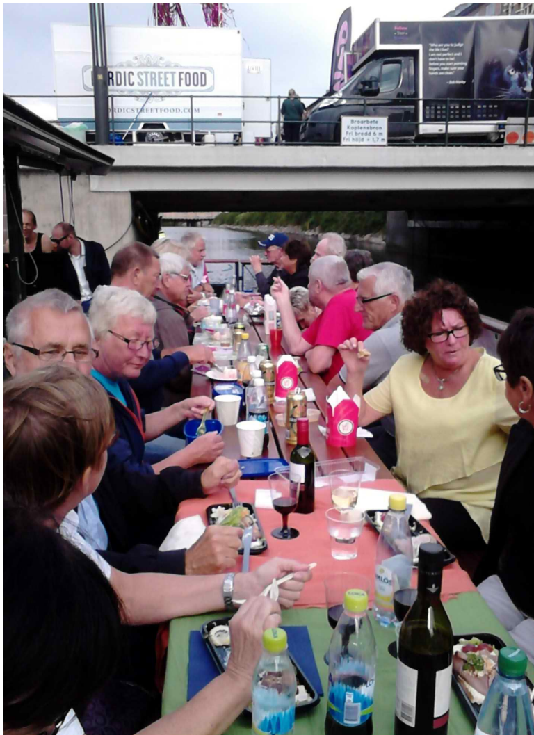
En bild till från Flotten