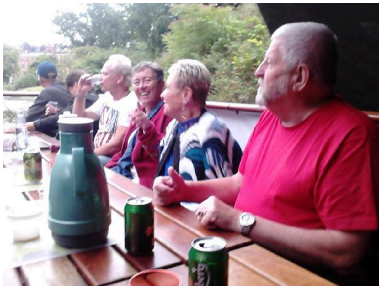
På Flotten den 16 augusti